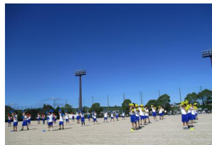
1・2年 みんなでたのしくエクササイズ!!