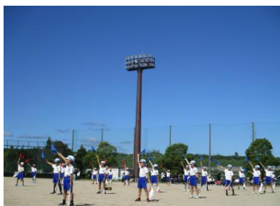
3・4年 グレイテスト ショー!