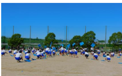
5, 6年 団結 ～共に未来へ～