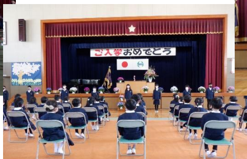
6年生の歓迎のよびかけ