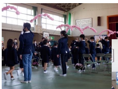
6年生の花のアーチ

満開の桜の下、4月8日（金）入学式が行われました。かわいい29名の新入生を迎え、在校生もうれしさいっぱいです。